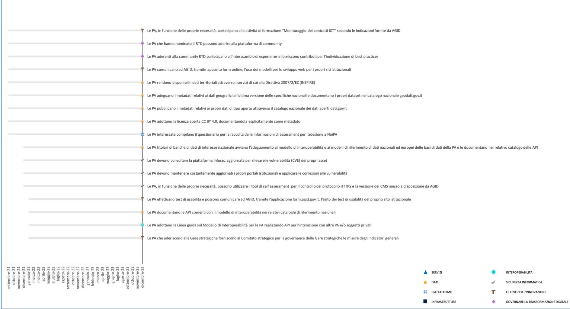
Figura 5 – Azioni 2021 - 2023 a carico di tutte le PA (3 di 4)