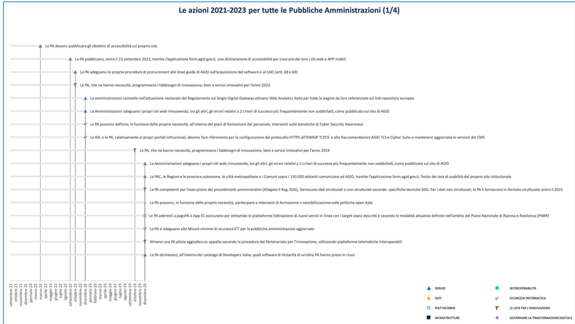
Figura 3 – Azioni 2021 - 2023 a carico di tutte le PA (1 di 4)