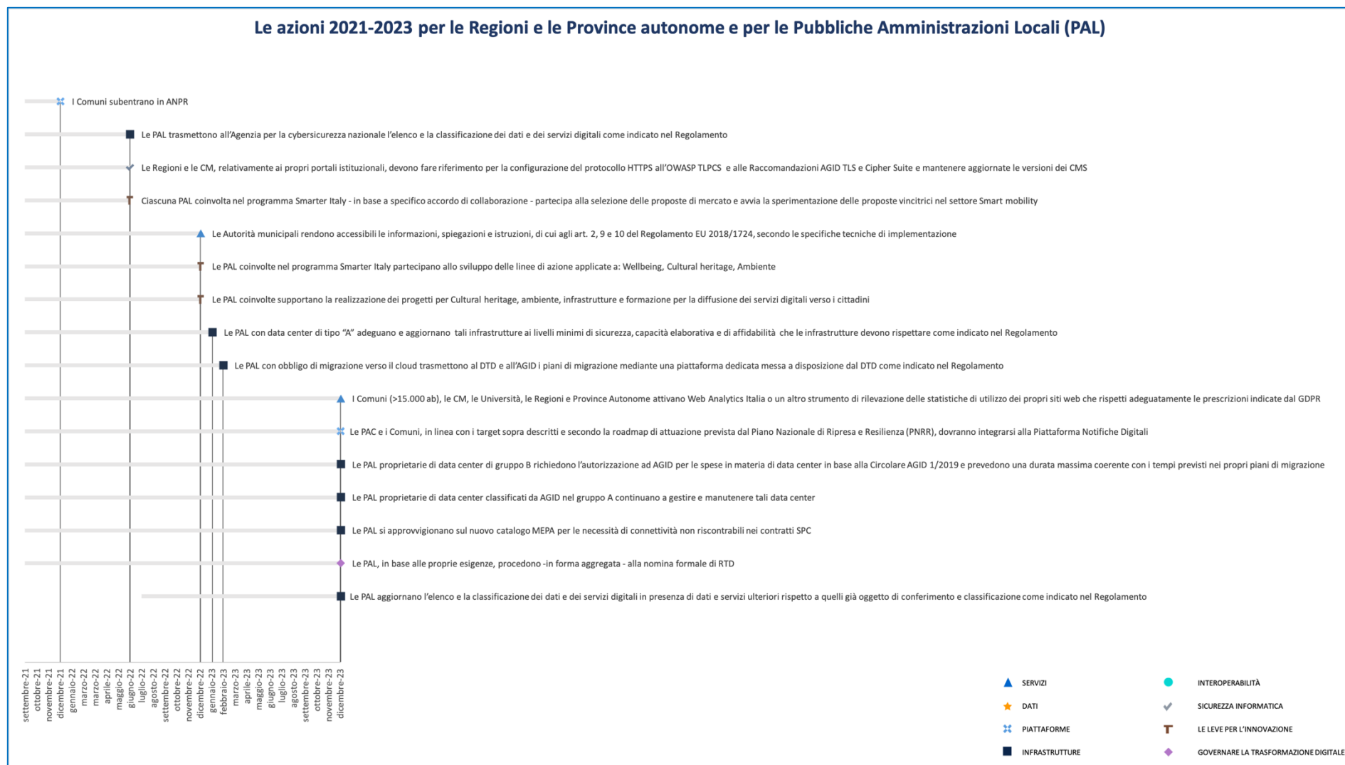
Figura 8 - Azioni 2021-2023 a carico delle Regioni, delle Province autonome e delle PA locali