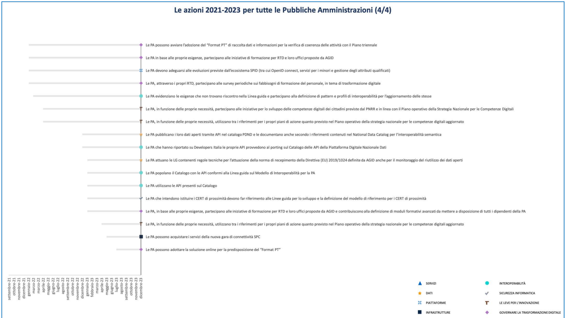
Figura 6 – Azioni 2021 - 2023 a carico di tutte le PA (4 di 4)